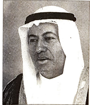
وزير العمل والشؤون الاجتماعية

أكد عبدالنبي عبدالله الشعلة وزير العمل والشؤون الاجتماعية في مؤتمر صحفي عقده بعد الاجتماع الموسع لسمو رئيس الوزراء مع القيادات المصرفية والمالية والتأمينية أمس ان الوزارة سوف تقوم بتنفيذ توجهات سموه فيما يتعلق بتسهيل استقدام الخبراء المصرفيين من الخارج نظرا للتميز الذي حققه القطاع والمعرض في مجال بحرنة الوظائف والتي بلغ معدلها 74٪ فيه إلى جانب 86٪ في القطاع المصرفي التجاري وحده.