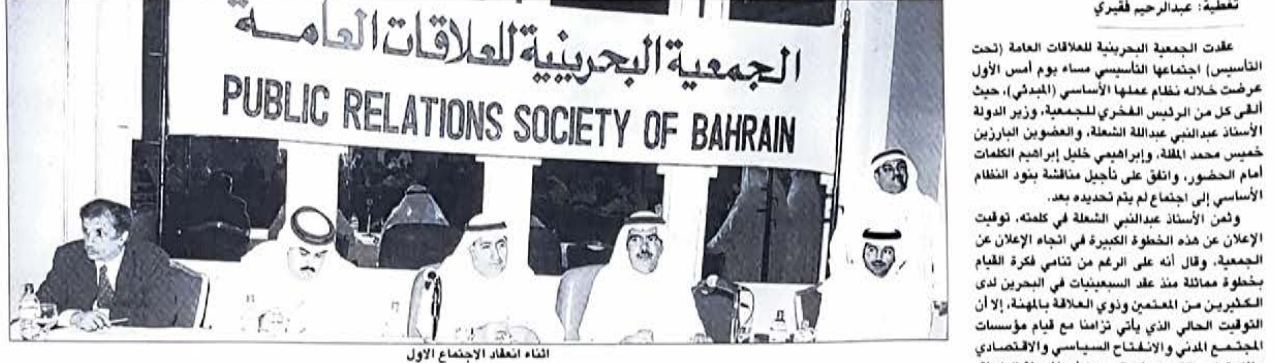
اتناء انعقاد الاجتماع الأول