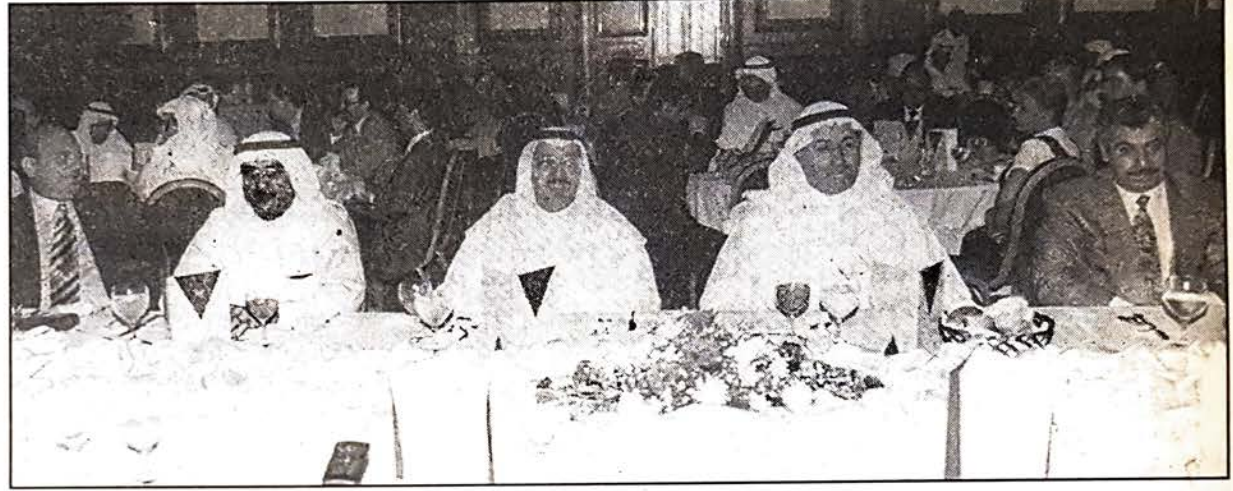
■ وزير العمل وكبار الضيوف