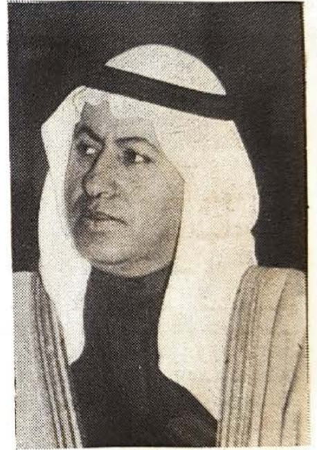
● وزير العمل

وأبدى الوزير تعاطفه مع عائلات العمال الضحايا والجالية البنغالية في البحرين مؤكداً ان البحرين ممثلة في وزارة العمل والشؤون الاجتماعية تحرص كل الحرص على توفير الرعاية والدعم للعمالة البنغالية وأشاد بدور العمالة الأسبوية بشكل عام والبنغالية بشكل خاص في المساهمة في المشاريع التنموية والاقتصادية في البلاد . كما استعرض الوزير مع السفير البنغالي العلاقات الوطيدة التي تربط بين البلدين الصديقين في المجالات العمالية والاجتماعية وأكد أهمية تطويرها وتنميتها كما ان الدور