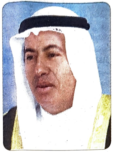
■ وزير العمل