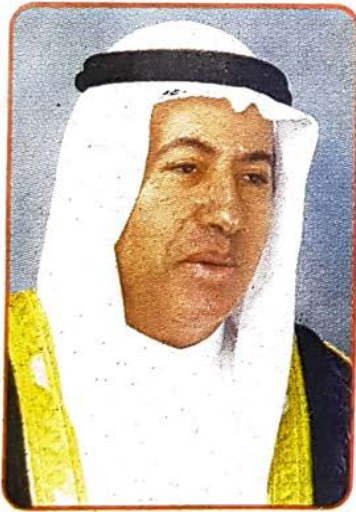
■ وزير العمل والشؤون الاجتماعية

على صيانة مبادئ الدستور وروح ميثاق العمل الوطني اللذين يجسدان ويرسخان هذه المبادئ والقيم الوطنية. واذاف وزير العمل والشؤون الاجتماعية بان الدولة ومن خلال مسيرة التحديث والاصلاح السياسي التي يقودها صاحب السمو امير البلاد المقدى لن نسمح بتأسيس جمعيات او تجمعات سياسية تهدف الى المشاركة في العمل الوطني والسياسي من خلال تجمعات او تكتلات طائفية او فئوية. واکد وزير العمل والشؤون الاجتماعية بان الوزارة تحرص في فتح تصاريح انشاء وتأسيس الجمعيات والمؤسسات الاجتماعية والمهنية على تطبيق الشروط والقوانين المعمول بها والتي تنظم عملية اشهار الجمعيات.