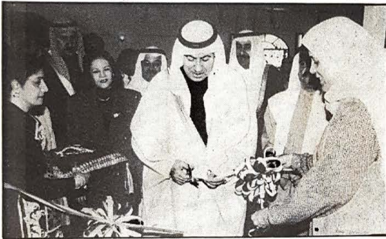
● وزير العمل يقص الشريط ايذانا بافتتاح المعرض

تطوير الانتاج بالمراكز الاجتماعية للارتقاء بمستواها وتوفير فرص عمل في هذا المجال