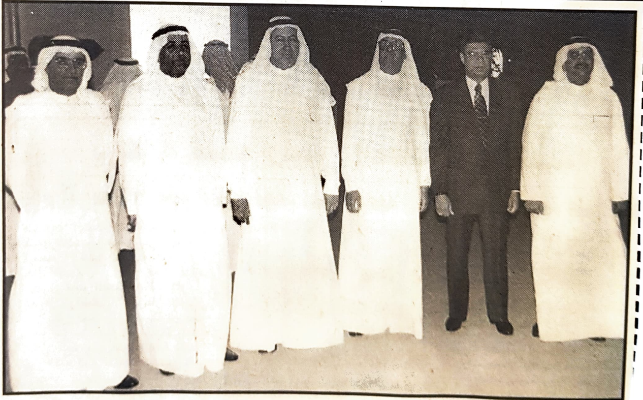
أقام وزير الأشغال والزراعة المهندس ماجد جواد الجشي حفلاً على شرف المشاركين في مؤتمر تطبيقات الحاسوب في الهندسة المدنية بفندق الهوليداي ان.