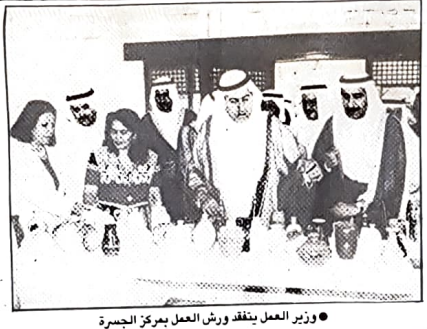
• وزير العمل يتفقد ورش العمل بمركز الجسرة

وشملت الشيخة لولوة مرة اخرى فائقة . لماذا لا تخصص لنا وزارة الاشواق الخيرية . لماذا لا تفكر الان جميع الجهات في ان تخصص لنا موردا ثابتا حتى تضمن على الاقل التواصل سريعا للعمل الخيري . والتأكدت الشيخة لولوة جميع اصحاب القلوب الرحيمة والخيرة بالوقوف الى جانب الجمعية وكل جمعيات تنصدي للعمل الانساني والخيري لأن في ذلك نلغا وخيرا لوطننا كاهله .