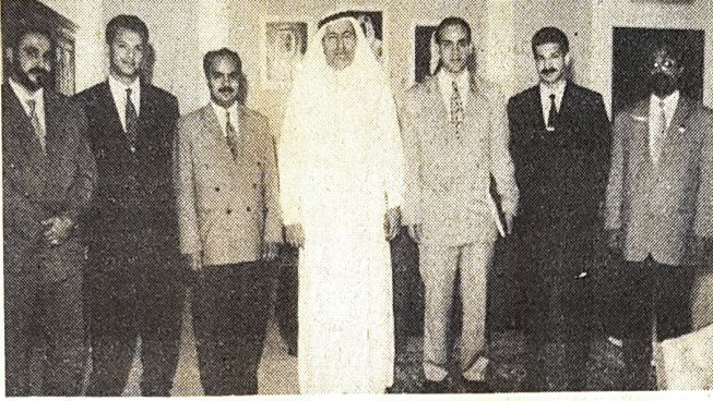
● وزير العمل لدى استقبال أبناء البحرين المتفوقين في دراسة الفنادق

استقبل السيد عبدالنبي عبدالله الشعلة وزير العمل والشؤون الاجتماعية بمكتبه صباح أمس الثلاثاء السيد عبدالنبي الدليمي رئيس المجلس النوعي للتدريب لقطاع التموين والفندقة الذي قدم له اثنين من الطلبة الحاصلين على دبلوم الفندقة من معهد مونترو بسويسرا وأربعة من الطلاب الجامعيين خريجي الجامعات العربية الذين يعملون منذ ٤ سنوات بفنادق البحرين بدعم من المجلس النوعي للتدريب بقطاع الفندقة.