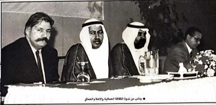
• جانب من ندوة الثقافة العمالية والإعلام العمال