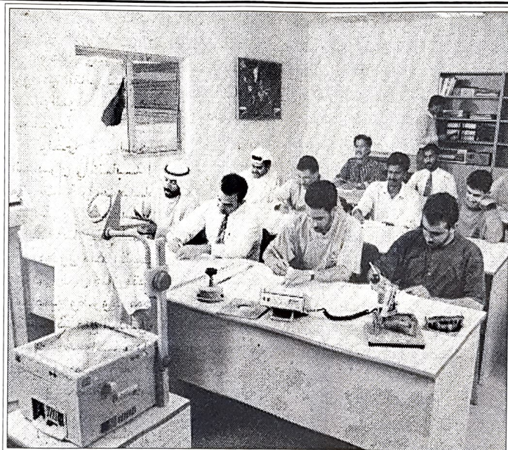
○ اثناء الدورة ○