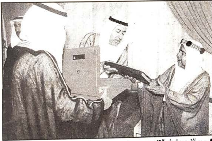
■ سمو الأمير يتسلم التقرير