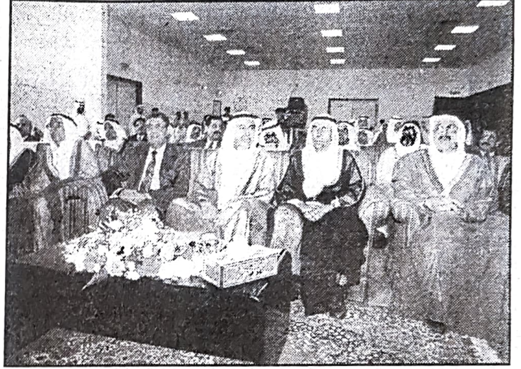
وزير العمل ورئيس مجلس الشورى وكبار الضيوف خلال الاستقبال

الرسمية والأهلية ودور القطاع الخاص في العمل مع المعوقين أن تجربة البحرين في هذا المجال تجربة رائدة بشار اليها بالبنان في الدول العربية والإقليمية، خاصة بعد تزايد الاهتمام بموضوع الاعاقة منذ مطلع السبعينات الذي شهد تأسيس أول مؤسسة لرعاية وتأهيل المعوقين وهي دار التأهيل للاطفال المعوقين التابعة لوزارة العمل والشؤون الاجتماعية.