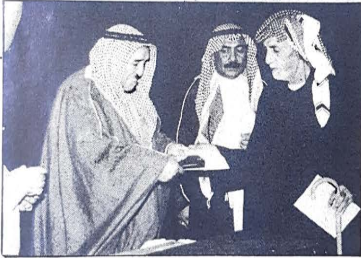
○ وزير العدل يكرم احد المتقاعدين ○