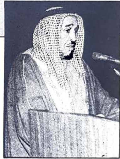
○ وزير العدل يلقي كلمته ○