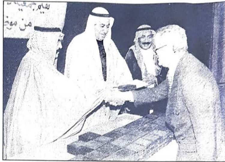
○ وزير العمل يشارك في التكريم ○

يتقاعدون في السنوات المقبلة بالتنسيق مع الجهات المعنية في وزارات العمل وجمعية دار الحكمة وهيئتي التقاعد والتأمينات وخلق اطار من الترابط الاجتماعي بينها وبين المتقاعدين كما يسعدني ان اعلن على حضراتكم بان الجمعية قد اعدت استمارة العضوية وانها تعلن فتح باب القبول لكل من يرغب من مواطني البلاد الكرام سواء من العاملين واصحاب العمل.