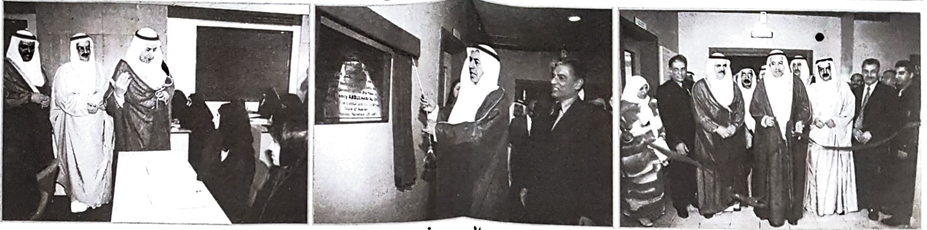
حفل الافتتاح السذي تحول إلى منبتهدي: