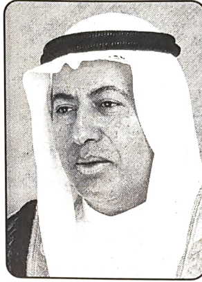
■ وزير العمل

أكثر من 400 فرصة عمل دائمة بعد الانتهاء من مرحلة البناء. وقال الرئيس التنفيذي بان الشركة تهتم كثيرا بتوفير مستلزمات الصحة والسلامة المهنية وخلق بيئة عمل سليمة وصحية تساعد العامل على انجاز المهام المنوطة به حيث تعتبر هذه الامور الخاصة ببيئة العمل والإنتاج من القضايا التي تأتي ضمن اعلى اولويات الإدارة بل انها تعتبره معيار ومقياس التطور للشركة وأن الشركة تعتمد في سياستها على ضرورة الاستفادة من امكانيات كافة موظفيها الذين هم من اهم استثماراتها.