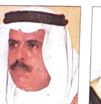
د. ماجد بن علي التميمي وزير التربية والتعليم