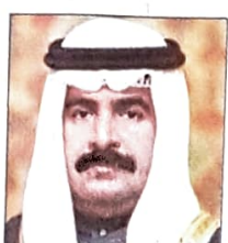
سمو الشيخ علي بن خليفة آل خليفة وزير المواصلات