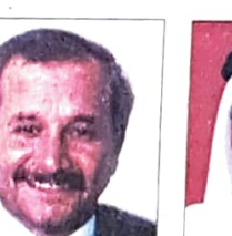
د. حسن بن عبدالله فخرو وزير الصناعة