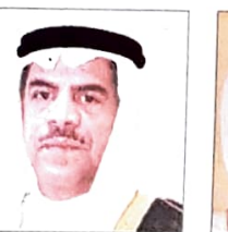
د. مجدد بن محسن العلوي وزير العمل والشؤون الاجتماعية