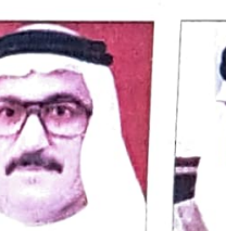
د. محمد بن عبدالغفار عبدالله وزير دولة للشؤون الخارجية