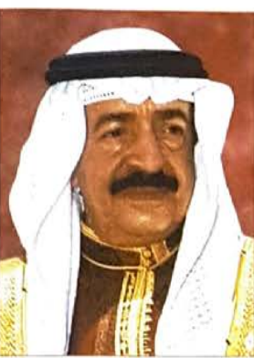
سمو رئيس الوزراء

السلام عليكم ورحمة الله وبركاته..... فانه إن دواعي سرورنا ان تعبر عن اسمي آيات الشكر والتقدير لما أولتمونا عظيمكم من ثقة عالية نعتز بها بالغ الإعتزاز وذلك بتشكيلكم لنا المرحلة الجديدة التي بدأت بالمرحلة الجديدة التي بدأت بصدا عظيمكم للتعدلات الدستورية في 14 فبراير سنة 2002 وما تلاه من أنظمة قانونية تعبر عن فكر جديد يحقق التطور السياسي والاقتصادي الذي يؤدي بتوفيق الله الى خير الوطن والمواطنين. ولم يكن يسعنا يا صاحب العظمة الا لتبني تكليفكم الكريم وحمل امانة المسؤولية بكل ما تحتاج اليه من جهد كبير وما تطوي عليه من تبعات جسام اداء ما يفرضه الواجب نحو الوطن الكلي واخلاصا ولاء وعظمتكم. ولقد تراسنا ما تضمنه كتاب التكليف بتشكيل الوزارة وامنا النظر فيما ورد به من