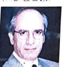
محمد بن ابراهيم المفلح وزير شؤون مجلس الوزراء