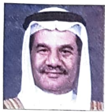
عبدالله بن حسن سيف وزير المالية والاقتصاد الوطني