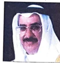
الشيخ خالد بن عبدالله آل خليفة وزير ديوان رئيس الوزراء