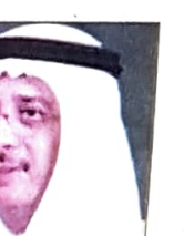
نبيل بن يعقوب الحمير وزير الاعلام