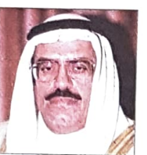
عبدالعزیز بن محمد الفاضل وزير دولة لشؤون مجلسي الشورى والنواب