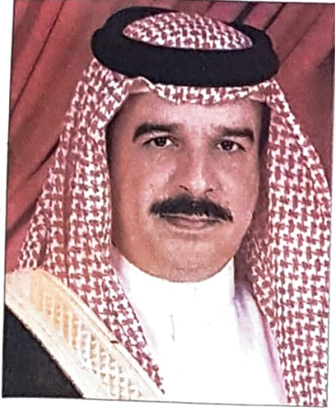
عامل البلاد المفدى

أصدر حضرة صاحب العظمة الشيخ حمد بن عيسى آل خليفة عامل البلاد المفدى مرسوما ملكيا رقم 48 لسنة 2002 بتشكيل الوزارة الجديدة برئاسة صاحب السمو الشيخ خليفة بن سلمان آل خليفة و23 وزيراً واستحدثت البحرين لأول مرة في تشكيلة وزارتها الحكومية التي أعلنت يوم أمس منصبى نائب لرئيس مجلس الوزراء حيث أصبح الشيخ عبدالله بن خالد آل خليفة نائباً لرئيس الوزراء ووزيراً للشؤون الإسلامية، والشيخ محمد بن مبارك آل خليفة نائباً لرئيس الوزراء ووزيراً للخارجية.