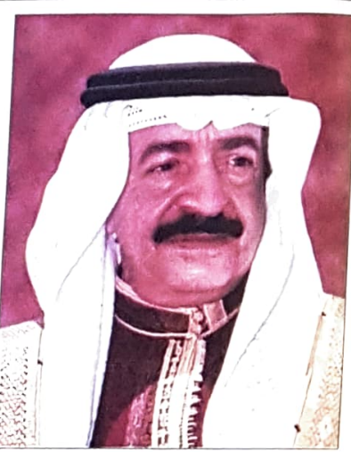
صاحب السمو الشيخ خليفة بن سلمان آل خليفة رئيس الوزراء