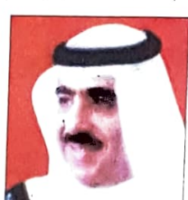
الشيخ محمد بن خليفة آل خليفة وزير الداخلية