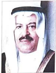
علي صالح الصالح

قال وزير التجارة علي صالح الصالح: اود ان ارفع اسمي آيات الشكر الى القيادة الحكيمة وعلى رأسها صاحب العظمة الشيخ حمد بن عيسى آل خليفة ملك مملكة البحرين المفدى والشيخ خليفة بن سلمان آل خليفة رئيس الوزراء والشيخ سلمان بن حمد آل خليفة ولي العهد على تجديد الثقة في تكليفني وتشريفني بوزارة التجارة، وارجو ان اكون بمستوى الثقة بالاضافة الي اعاهدهم ان اعلم لتجسيد طموحاتهم وطموحات القطاع التجاري في الارتقاء بوزارة التجارة لتجسد الطموح بتطوير مستوى الاداء بالنسبة