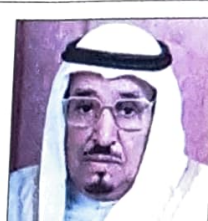
الشيخ عبدالله بن خالد آل خليفة نائب رئيس الوزراء وزير الشؤون الإسلامية