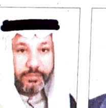
د. محمد بن علي الشيخ السري وزير شؤون مجلسي الشورى والزراعة