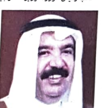
الشيخ عيسى بن علي آل خليفة وزير النفط