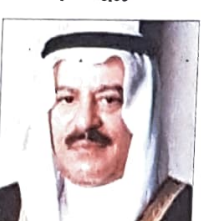
علي بن صالح الصالح وزير التجارة