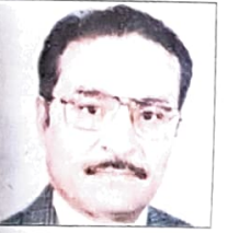
د. خليل بن ابراهيم حسن وزير الصحة