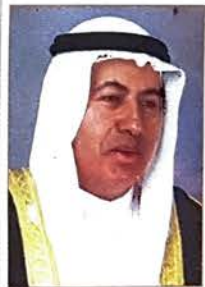
عبدالنبي عبدالله الشعلة

وقد صرح وزير الدولة عبدالنبي عبدالله الشعلة بان التشكيلة الحكومية الجديدة متكاملة ومتميزة لانها احتفظت بالعديد من الخبرات العريقة في العمل الحكومي، الى جانب انها ضمت دماء جديدة ستعطي ايضا زخما جديدا للعمل الوزاري. وقال الوزير الشعلة بان التشكيلة تنسجم كذلك مع احتياجات المرحلة القادمة والتي ستكون بلاشك زاخرة بالعمل الوطني المثمر والمزدهر والذي سيتعاطى بفاعلية مع الاحداث والفرص المقبلة.