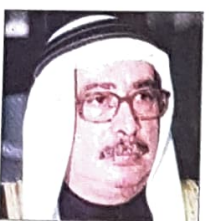
جواد بن سالم العريض وزير العدل