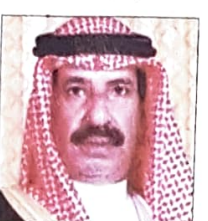
الشيخ عبدالله بن سلمان آل خليفة وزير الكهرباء والماء