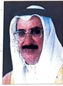
الشيخ خالد بن عبدالله آل خليفة

قال وزير ديوان رئيس مجلس الوزراء الشيخ خالد بن عبدالله آل خليفة يشرفني ان اتقدم لحضرة صاحب العظمة الشيخ حمد بن عيسى آل خليفة الملك المفدى وصاحب السمو الشيخ خليفة بن سلمان آل خليفة رئيس الوزراء وصاحب السمو الشيخ سلمان بن حمد آل خليفة ولي العهد بخالص العرفان والامتنان على ثقة سموه الغالية التي اعز بها وتكليفني بالعمل في موقع جديد لخدمة الوطن العزيز، وانه يشرفني بهذه المناسبة ان اجدد لسموه عهد الولاء والانتماء وان اعمل لخدمة مملكة البحرين في اي موقع عمل ولتقديم اي مسؤلية.