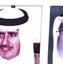
فهمي بن علي الجودر وزير الأشغال والإسكان