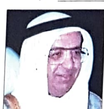
الشيخ محمد بن مبارك آل خليفة نائب رئيس الوزراء وزير الخارجية