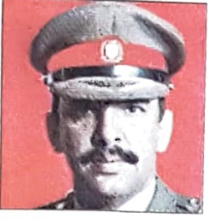
الشيخ خليفة بن أحمد آل خليفة وزير الدفاع