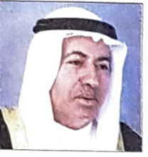
عبدالنبي بن عبدالله الشعلة وزير دولة