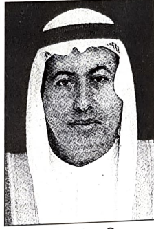
○ وزير العمل

وأعربت عن سعادتها بعقد هذه الندوة في مملكة البحرين ومشاركة وفود من الدول العربية الشقيقة متمنية ان تخرج الندوة بتوصيات وقرارات تسهم في تطوير المشروعات الاجتماعية والإنمائية في البلاد العربية.