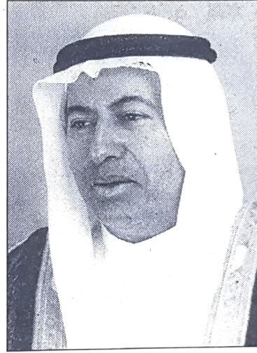
وزير العمل والشئون الاجتماعية

بكثير، برامج الدبلوما الوطنية فصليا لا تزيد على الـ 100 دينار، في حين تبلغ رسوم التدريب الحرفي 33 دينارا على ان اعلى رسوم تسجل في برنامج الدبلوما العليا والتي تبلغ 300 دينار.