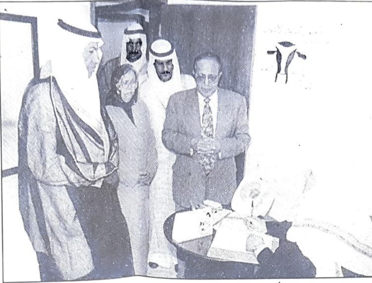
■ وزير العمل في زيارة للمركز