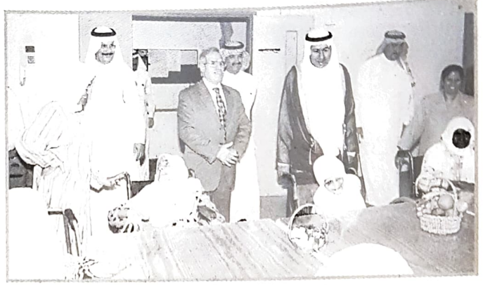
وزير العمل ووزير الصحة يتفقدون الوحدة