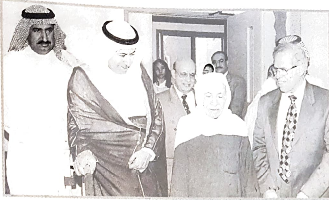
وزير الصحة ووزير العمل يتكلمون مع احد المسنين