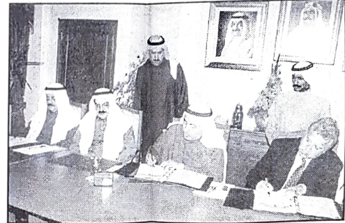
■ خلال توقيع الاتفاقية

امام القطاع الخاص للتأهيل ودعمًا وتعزيزًا لدور دولة البحرين كمركز اقليمي لخدمات التدريب وتنمية الموارد البشرية ويأتي ايضا ضمن سلسلة مراكز ومعاهد التدريب التي بدأت بالفعل تمارس نشاطها في البلاد. هذا وسيعمل المركز على تنفيذ برامج تدريبية مختلفة لتطوير مهارات القوى العاملة في مجال المهارات الاساسية في الحاسب الآلي والالكترونيات والتدريب على مختلف المهن والحرف. حضر التوقيع على الاتفاقية الشيخ عبدالرحمن بن عبدالله آل خليفة وكيل وزارة العمل والشؤون الاجتماعية المساعد لشؤون العمل وصديق الشهابي الوكيل المساعد للشؤون الاجتماعية وعبدالرحمن الزباني الوكيل المساعد للتخطيط والتدريب وعدد من المسؤولين بالوزارة والشركة.