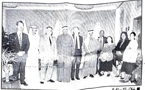
■ خلال الاستقبال

الاستشاري المتعدد التخصصات للدول العربية بمكتب العمل الدولي بأنه تم خلال المقابلة بحث صياغة اطار عام لكافة نشاطات المشروع والبدء في تنفيذ تلك النشاطات، وقال ان الهدف الاساسي من هذا المشروع هو تنظيم سوق العمل من النواحي