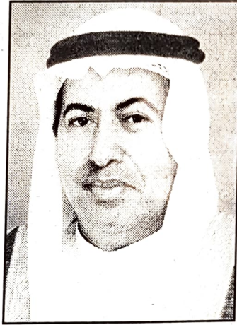
■ وزير العمل

قال وزير العمل والشئون الاجتماعية عبدالنبي الشعلة ان الوزارة تعمل على تشكيل لجنة وطنية للمؤهلات المهنية سيتم تشكيلها من مؤسسات القطاع الخاص لتكون لها مهام تأسيس البرنامج وتحديد ادوار الجميع ، كما سيتم تشكيل مجموعات عمل كخطوة ثانية تضم المجالس النوعية للتدريب في القطاعات الفندقية والمصرفية والمالية والمقاولات لتشكيل النواة لهذا الامر وهي التي ستكون الكيانات المانحة للشهادات والتي تقدم الامتحانات وتدقق فيها كأطراف اساسية.