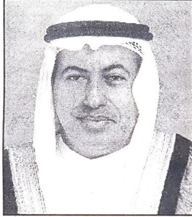
■ وزير العمل والشؤون الاجتماعية

وبهذه المناسبة صرح وزير العمل والشؤون الاجتماعية قائلاً: إنه انطلاقاً من الالتزام بالواجبات والمسؤوليات المناطة بوزارات العمل والشؤون الاجتماعية بدول مجلس التعاون لدول الخليج العربية في إيلاء العمل الاجتماعي الاهتمام المناسب والرعاية الكاملة ليؤدي دوره التنموي في المجتمعات الخليجية ويسهم بشكل وافر في رفاهية ورخاء هذه المجتمعات تقام فعاليات الأسبوع العربي الخليجي الرابع للعمل الاجتماعي تعزيزاً لهذا التوجه الطيب.