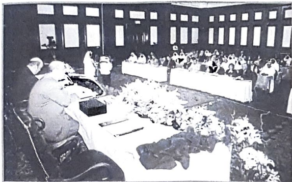
○ جانب من الجلسة الختامية