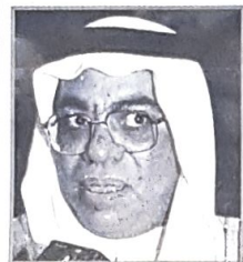
○ كامل الصالح

وحول التحديات التي تواجه الألفية القادمة يقول كامل صالح الصالح -مدير عام المكتب التنفيذي لمجلس وزراء العمل والشؤون الاجتماعية لدول مجلس التعاون - أن أهم تحدي يواجه المنطقة والعالم أجمع هو تطوير فرص الحوار بين الحضارات والثقافات، ومن خلال هذا التطوير لفرص الحوار والتعايش سوف نستطيع تحقيق فرص أوسع للسلام بين العالم. ومن الملاحظ أن طموحات الشعوب في عصرنا الحاضر تنصب على التنمية، ولا يمكن تحقيق التنمية إلا بالحوار والاستقرار والسلام، ولا يمكن ضمان هذا الأمن إلا خلال قبول الرأي الآخر والترفد الآخر من خلال الحوار البناء والتسامح، ومن خلال التعايش بين اللغات التي تثرى التجربة الإنسانية في الألفية القادمة. ويضيف قائلا: علينا أن نعلم أن فرص التلاقي والاستخدام المتكامل المتكثرة هي التي ترجح كفة الحضارة، إذا كان هناك خلاف أو تباين لابد أن ننظر إليه على أساس أنه قضايا هامشية، ما يجمع الشعوب على الصعيد التنموي هو الأهداف والغايات أكثر مما يفرقها، فعلينا أن نركز على الجانب الإيجابية ونبتني جسور من التقاهم والتعايش السلمي بين الشعوب.