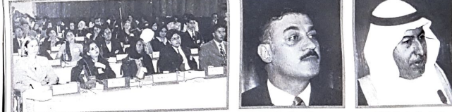
وزير العمل يلقي كلمة

الملتقى يمنح الفرصة لشباب لتفاعل مع القضايا العالمية