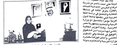
وزير التربية يكرم العالمية أمينة على

صرح الاستاذ عبدالعزيم محمد الفايز وزير التربية والتعليم بأن الوزارة حريصة ودعم كافة الأنشطة التربوية لما لها من دور حيوي وفعال في تعامل أبناء شخصية الطالب جنباً إلى جنب مع المناهج الدراسية. وأضاف أن الوزارة تترجم هذا اهتماماً وبأبنائها من المرزبين من مجالات الأنشطة المختلفة.