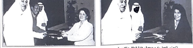
وزير العمل يكرم جمعية رعاة الظل والأومعة

ويعلن : المشروع يهدف إلى توفير فرص العمل وتحويل الأسر المعانة إلى منتجة