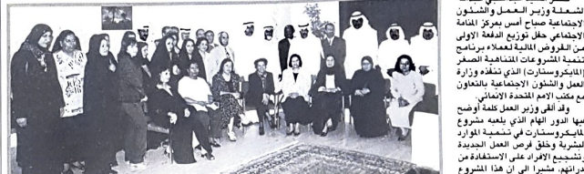
وزير العمل في صورة جماعية للدفعة الأولى من منفيدي المشاريع الصغيرة