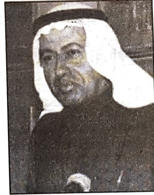
■ وزير العمل

تهتم بتدريب وتنمية الموارد البشرية واعدادها في المستقبل لمواجهة خضم التحديات التي