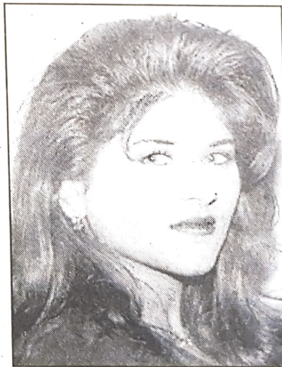
■ احدى خريجات معهد التدريب

حضر وزير العمل والشؤون الاجتماعية عبدالنبي الشعلة حفل تخرج الفوج الاول من متدربي معهد البحرين للتدريب بقاعة السفراء بفندق الدبومات وقدلقى وزير العمل والشؤون الاجتماعية كلمة اعرب فيها عن الشكر والتقدير لصاحب السمو رئيس الوزراء على تفضله بوضع هذا الحفل تحت رعاية سموه مشيراً باهتمام سموه وعنايته الفائقة بالتعليم والتدريب وتنمية الموارد البشرية وتأهيل الأيدي العاملة الوطنية. و اضاف بان تجربة معهد البحرين للتدريب تؤكد الحاجة الماسة الى التعاون مع كافة مؤسسات القطاع الخاص والاعتماد عليها في توسيع قاعدة التدريب في البلاد وتشجيعها على اقامة مراكز تدريبية متخصصة في مختلف المجالات.