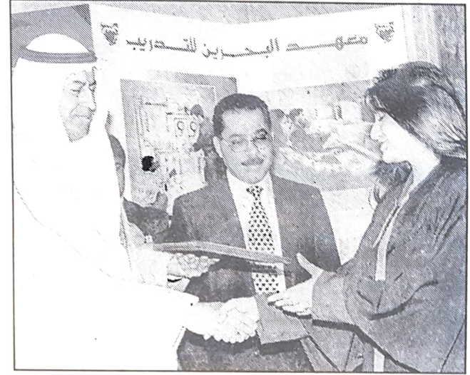
■ وزير العمل يسلم الشهادة لاحدى الخريجات