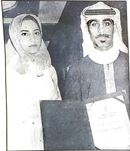
■ احد الخريجين