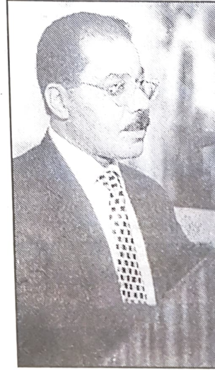
■ كلمة مدير المعهد