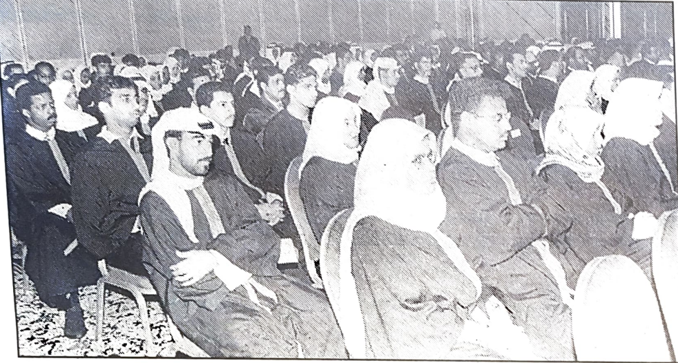
■ جانب من الحضور