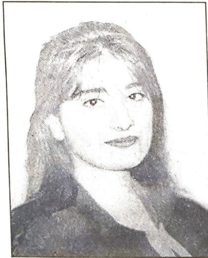
■ صورة لاحدى الخريجات