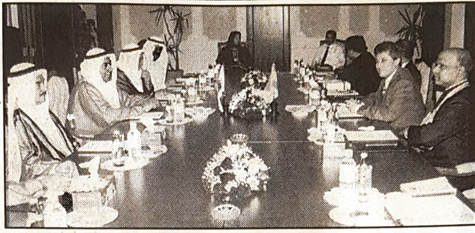
○ وزير العمل ووزير الدولة للشئون الخارجية الهندي اثناء الاجتماع