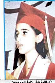
○ طالبة تلقي كلمة الخريجين

أثارت صاحب السمو الشيخ خليفة بن سلمان آل خليفة رئيس الوزراء سمو الشيخ علي بن خليفة آل خليفة وزير المواصلات لحضور حفل تخرج طلبة مدرسة ابن خلدون الوطنية لعام ١٩٩٩م والذي أقيم في الساعة السابعة من مساء أمس بمركز الخليج الدولي للمؤتمرات. وحضر الحفل عدد من السادة الوزراء وكلاء الوزارات وكبار المسؤولين بالدولة ورجال السلك الدبلوماسي وأولياء أمور الطلبة والطلبات وعدد من الدعويين وطلبة المدرسة.