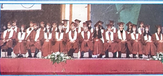
○ الطلبة الخريجون