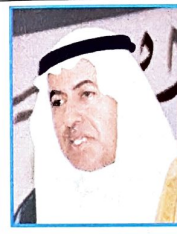
○ وزير العمل والشؤون الاجتماعية بقى كلمته