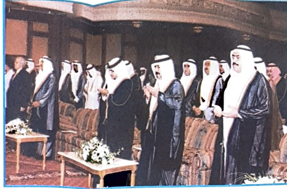
○ الحضور بقراون الفاتحة على روح لقيده البحرين الكبير