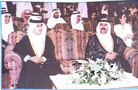
○ سمو وزير المواصلات وسمو وزير شؤون الديوان الأميري خلال الاحتفال