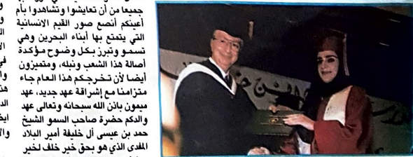
○ تسليم شهادات التخرج