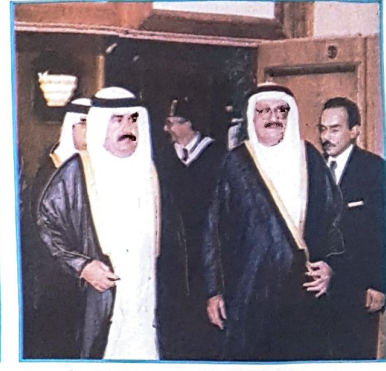
○ سمو وزير المواصلات يستقبله رئيس مجلس ادارة المدرسة