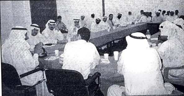
الوزير عبدالحسن الحاكبي مع وفد من ارباب العمل في نادي سماهيح.

ورحب الشعلعة بعقد المزيد من اللقاءات لتخلل الشعلعة في سوق العمل، وان الحوارات تمت مع سفراء لدول التي ينتمي اليها اولئك العمال، وان افضل طريقة لحصرهم هو ضبطهم في مواقع العمل. وأكد الشعلعة ان موقف الوزارة في شأن التوظيف في دول مجلس التعاون يأتي مستجماً من قرارات اللجنة الخليجية الناجمة الى تشجيع توظيف الابدري العمالة الوطنية وانتقالها بين الاجرة الحكومية وتبلغ نسبتهم 11٪