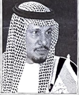
وزير العمل السعودي