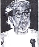
وزير العمل العماني