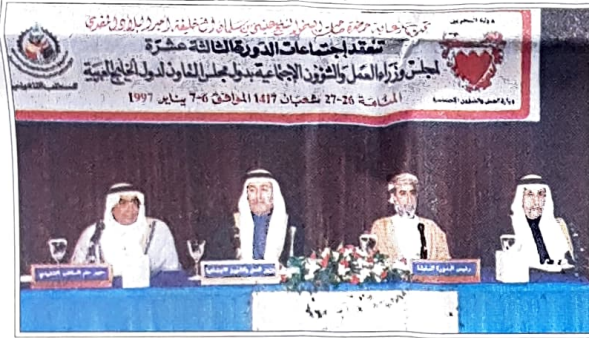
○ جلسة افتتاح المؤتمر