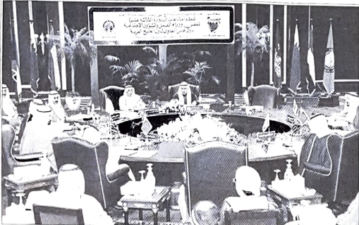
جلسة العمل الأولى