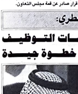
وزير الخدمة المدنية القطري