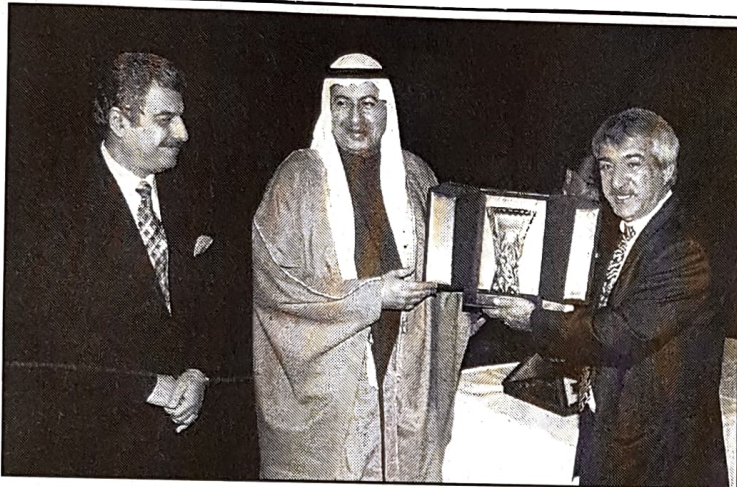
ويسلم الكأس الى نائب المدير التنفيذي