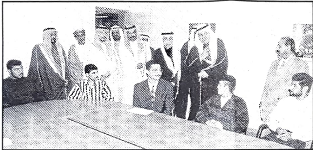
..ويطلعون على جانب من خدمات