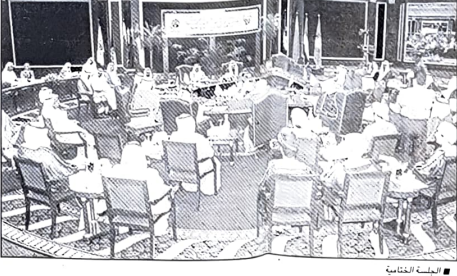
الوزراء الاجتماعيين من دول مجلس التعاون

تحت إشراف سمو وزير العمل والشؤون الاجتماعية عدداً من المسؤولين من دول مجلس التعاون الاجتماعيين في مجال تنظيم سوق العمل وتنفيذ برامج ملحوظة للتدريب والتأهيل وإيجاد أوسع النطاقات الاقتصادية والإنتاجية.