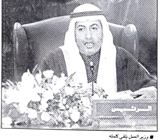
سمو أمير البحرين