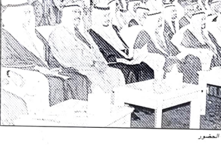
الوفد البحريني في اجتماعه

تحت إشراف سمو وزير العمل والشؤون الاجتماعية عدداً من المسؤولين من دول مجلس التعاون الاجتماعيين في مجال تنظيم سوق العمل وتنفيذ برامج ملحوظة للتدريب والتأهيل وإيجاد أوسع النطاقات الاقتصادية والإنتاجية.