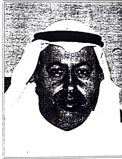
○ وزير العمل

ورفعت فيها ارواح بريئة في سعيها نحو كسب لقمة العيش الكريمة. وهذه الحوادث في جملتها كانت ناتجة عن عدم التزام بعض اصحاب الاعمال باشتراطات السلامة المهنية، وقيامهم بتوظيف عمالة اجنبية غير