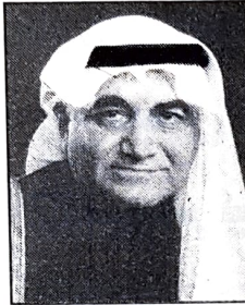
علي بن يوسف فخر