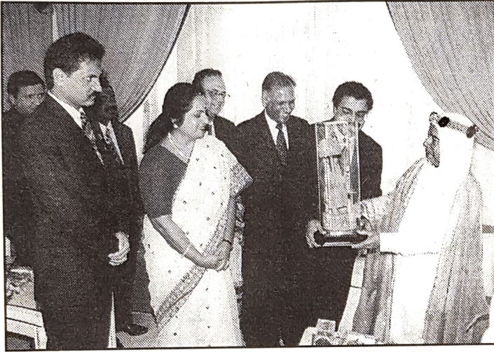
سموه يتسلم هدية تذكارية