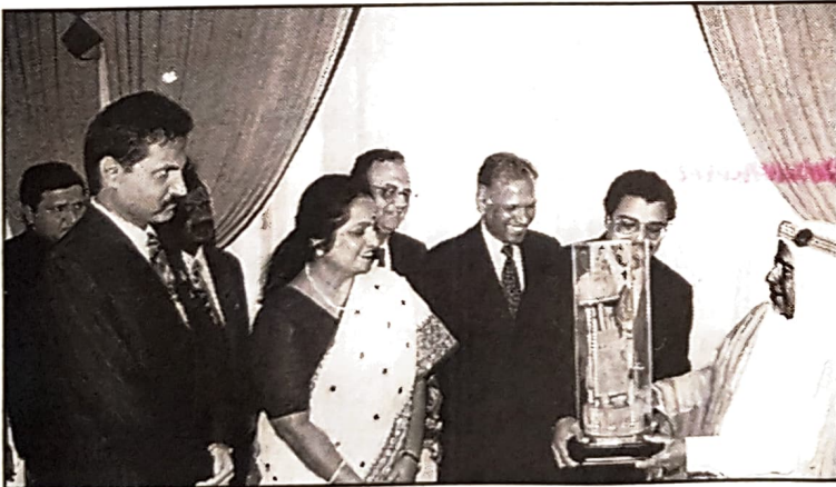
○ وهدية تذكارية لسمو الامير

نوه حضرة صاحب السمو الشيخ عيسى بن سلمان آل خليفة أمير البلاد المفدى بعطاء الجالية الهندية في البحرين ودورها في الاسهام في عملية التنمية الاقتصادية والاجتماعية. جاء ذلك خلال استقبال سموه لجنة التنسيق بين الجمعيات الهندية العاملة في البلاد. فقد استقبل حضرة صاحب السمو الشيخ عيسى بن سلمان آل خليفة أمير البلاد المفدى بمجلس سموه بالرفاع في الساعة الثامنة من صباح أمس لجنة التنسيق بين الجمعيات الهندية العاملة في البلاد برئاسة السيد سيمون بببي وذلك للسلام على سموه بمناسبة احتفالات اللجنة بمرور خمسين عاما على استقلال جمهورية الهند، وتنظيم عدد من الفعاليات والبرامج الهندية في البحرين، مشيرا سموه الى متانة العلاقات التي تربط بين دولة البحرين وجمهورية الهند وما تشهده من تطور ونماء في شتى المجالات مؤكدا سموه حرص البحرين على تعزيز وتطوير هذه العلاقات لما من شأنه مصلحة شعبي البلدين الصديقين منوها سموه بدور الجمعيات الهندية في دعم هذه العلاقات والمساهمة في تطوير الروابط الثقافية والحضارية مما سيكون له أكبر الأثر في اقامة مزيد من جسور التواصل والتعاون بين البلدين ويعزز العلاقات التاريخية بينهما. حضر المقابلة السيد عبدالنبي عبدالله الشعلة وزير العمل والشؤون