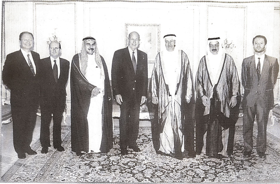
صورة تذكارية تجمع وزير العمل مع الرئيس الفرنسي السابق