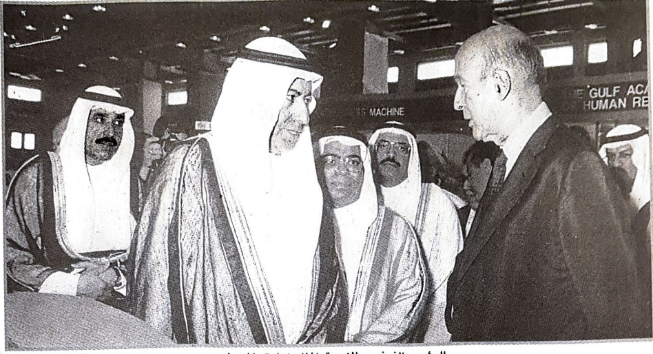
الرئيس الفرنسي الأسبق أثناء زيارته المعرض