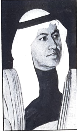
● وزير العمل ●

بالإضافة إلى ذلك فإن هذه الخطوة تعد دعماً للمبادرة التي قام بها السيد / عبد النبي عبدالله الشعلة، وزير العمل والشؤون الاجتماعية لتدعيم مكانة البحرين باعتبارها مركزاً تدريبياً لخدمة المنطقة والاستفادة من الخبرة المتاحة حالياً واستغلال موقع البحرين المتميز في المنطقة.