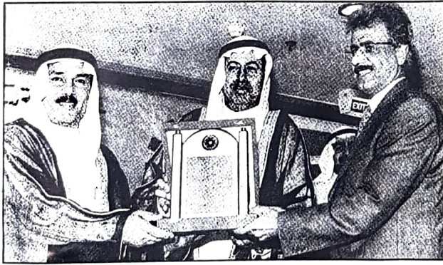
○ مدير عام بنك البحرين الوطني يتسلم درع البحرية