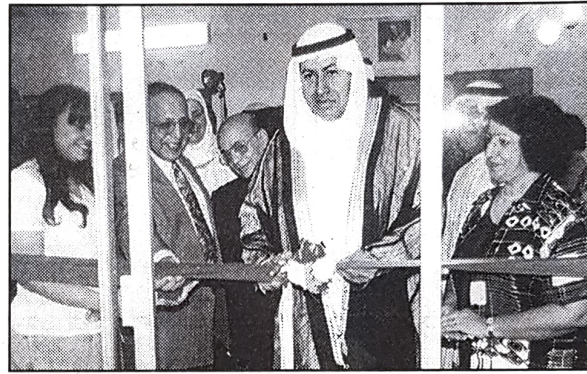
■ جانب من افتتاح مركز المشورة

افتتح وزير العمل والشؤون الاجتماعية صباح أمس مركز المشورة التابع لجمعية تنظيم ورعاية الأسرة الواقع في منطقة «القفول». وأعرب عن سروره بهذا المركز الذي يعد خطوة ومبادرة مهمة تضاف إلى رصيد إنجازات جمعية تنظيم ورعاية الأسرة التي تستحق كل تقدير وثناء.