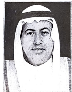
○ وزير العمل