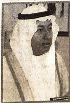
○ السيد عبدالنبي عبدالله الشعلة وزيراً للعمل والشئون الاجتماعية.