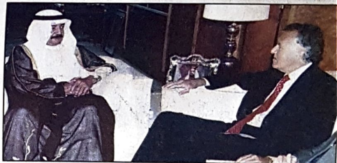
سمو رئيس الوزراء لدى استقباله الوزير البريطاني

اشاد صاحب سمو الشيخ خليفة بن سلمان آل خليفة رئيس الوزراء بعمق العلاقات الوطيدة التي تربط بين البحرين وبريطانيا وما يحرص عليه البلدان من تعزيز آفاق التعاون المشترك بينهما على كافة الاصعدة. جاء ذلك خلال استقبال سموه امس لوزير الدولة للشئون الخارجية البريطاني والكومونولث بترهين. وقد اشاد بترهين بالعلاقات الوطيدة وبما تشهده البحرين من تطورات متميزة على كثير من الاصعدة منها بصفة خاصة بقرار اشراك المرأة البحرينية في عضوية مجلس الشورى.