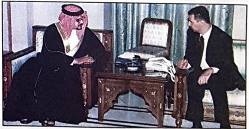
سمو ولي العهد لدى تقديم تعازيه الى د. بشار الاسد

كما قدم سموه تعازي دولة البحرين اميراً وحكومة وشعباً الى الفريق الدكتور بشار حافظ الأسد القائد العام للجيش والقوات المسلحة.