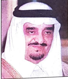
خادم الحرمين الشريفين