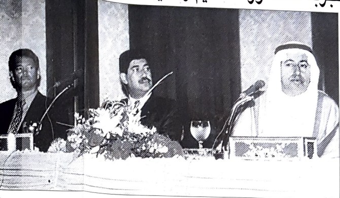
ندوة البحرة وحفائق حول اوضاع العمالة في سوق المقاولات.

وتشير الارقام التي استعرضها الوزير المشغلة بشأن تطوير نسبة البحرة في قطاع التشييد والبناء خلال الفترة من 1994 وحتى 1998 الى ان اجنابي العاملين في هذا القطاع يتناقص بحوالي 500 عامل سنويا. البحرينيين يتزايدون بحوالي 500 عامل سنويا. الاجانب يتناقصون بحوالي 1000 عامل سنويا في حين ان نسبة البحرة تضاعفت خلال السنوات الخمس الاخيرة في هذا القطاع. واذا استمر الوضع على ما هو عليه - حسب التثغلة 0 فان ذلك يعني استيعاب ذلك القطاع 2500 فرصة عمل للبحريين حتى عام 2003 وانخفاض العمالة غير البحرينية بمقدار 5000 الاف عامل حتى ذلك