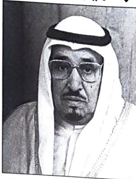
○ الشيخ عبدالله بن خالد آل خليفة

ودعا البنكي جميع المواطنين والمقيمين للمساهمة في هذا المشروع ولو بالقليل، كما وجه لهم دعوة لحضور هذه التضاهرة الاحتفالية التي ستقام بمركز البحرين الدولي للمعارض ١٨ نوفمبر الجاري وسيصاحب الحفل المعرض السنوي لأعمال وانجازات لجان جمعية التربية الإسلامية.