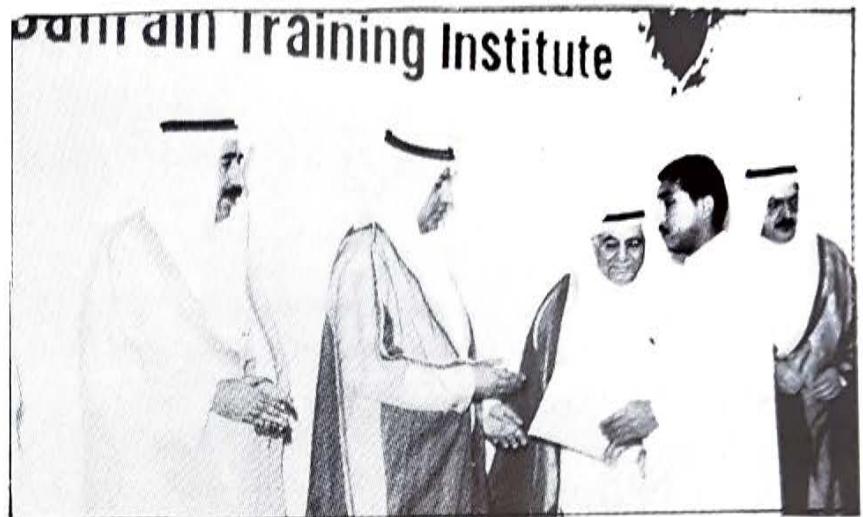
● وزير العمل يكرم أحد الخريجين ●

التخفيض - الذي بدأ العمل به بالفعل - سيكون من الساعة السابعة صباحاً الى الساعة مساءً كل يوم أحد إضافة لساعات التخفيض المعتادة المتوفرة ليلاً من الساعة مساءً وحتى الساعة صباحاً.