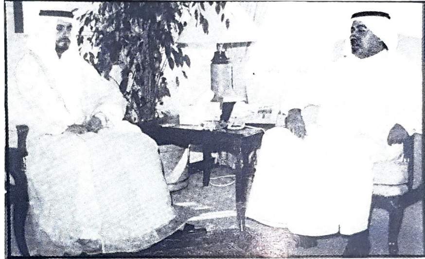
○ ○ وزير العمل والشئون الاجتماعية يستقبل السيد العصري سعيد أحمد الظاهري سفير دولة الامارات المتحدة لدى الدولة.