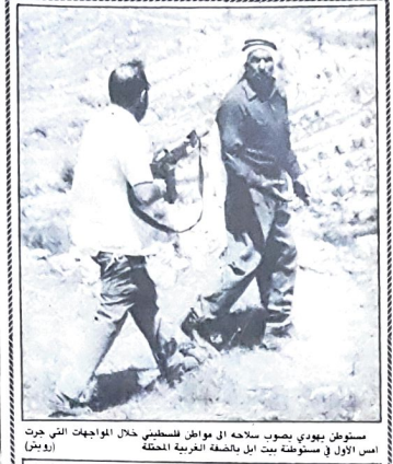
مستوطن يهودي يصوب سلاحه الى مواطن فلسطيني خلال المواجهات التي حدثت في الأول من سبوتونة بين اهل بلدة العربية المحتلة (رويت)