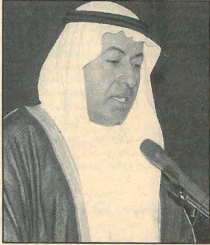
■ وزير العمل

حسن عبدالله فخرو رئيس مجلس ادارة الجمعية البحرينية قال فيها ان المؤتمر يجسد حسن وطموح قيادتنا العزيزة ويؤكد اهتمامها المتنامي في تشجيع الشباب واحتضان مواهبهم والمشاركة الفعالة في كل ما من شأنه رفعة الوطن وتطوره ورقبه. ثم القى عبدالنبي عبدالله الشعلة وزير العمل والشؤون الاجتماعية كلمة نقل خلالها تحيات صاحب السمو الشيخ سلمان بن حمد آل خليفة نائب سمو امير البلاد المقدي وتمنيات سموه للمؤتمر كل التوفيق والنجاح والسداد مشيراً الى ان قضية الطفولة بكافة جوانبها تأتي على رأس اولويات القيادة الحكيمة للبلاد وحكومتها الموقرة وانها تأتي في صدارة اهتمامات سموه شخصياً ولعل رعاية سموه لهذا المؤتمر لدليل واضح واكيد على هذا الاهتمام الكبير. وازاف ان سموه حرص ايضا على اهمية مواضيع هذا المؤتمر التي جاءت متزامنة ومتوakبة مع تكثيف اهتمام الدولة بالطفل وادراكها التام وقناعتها الراسخة بان الطفل هو نواة المستقبل وثروة الأمة وذخيرتها وهو الامل والمسئولية معا وان الاهتمام به هو استثمار حقيقي فائق الجدوى سيأتي مردوده دون